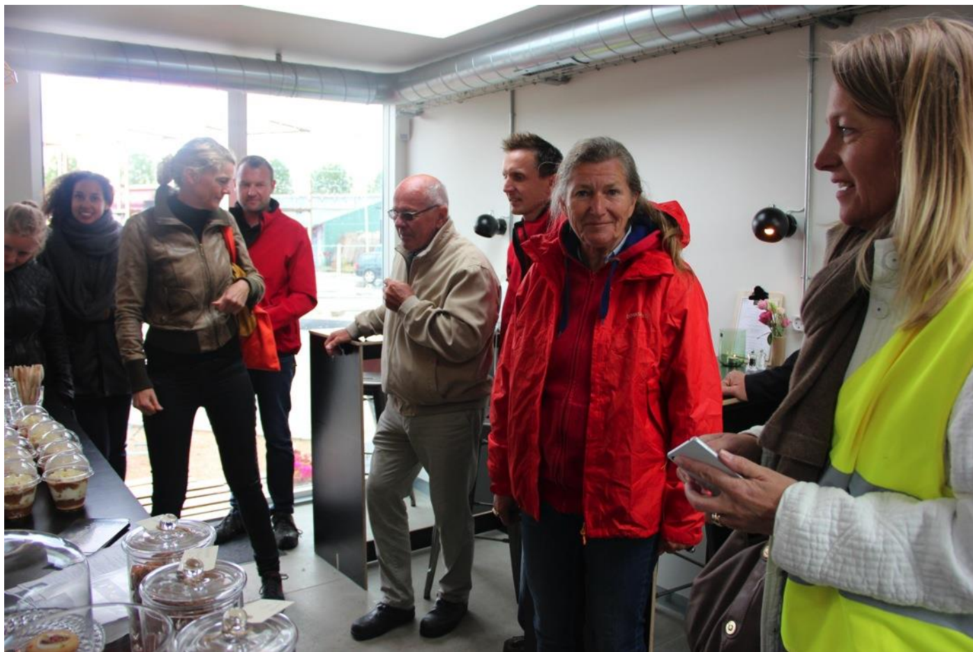
Eftermiddagen afslutter vi i den hyggelige lille cafe, Café Freunde, hvor vi nyder en forfriskning og netværker.