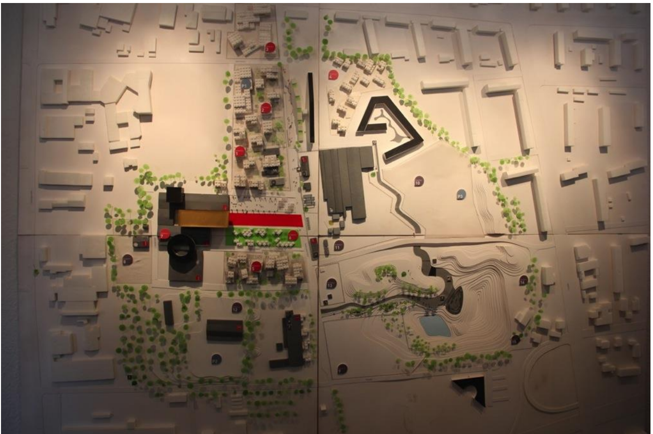
Ved siden af Danmarks Rockmuseum kommer Roskilde Festivals nye hovedkvarter og Roskilde Festivals højskole til at ligge. De tre byggerier kaldes samlet for Rockmagneten, som vil blive et kulturelt samlingspunkt centralt i Musicon.