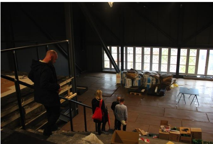
Danmarks Rockmuseum er ca. 3000 m 2 stort, hvoraf ca. 1100 m 2 er udstillingsareal.