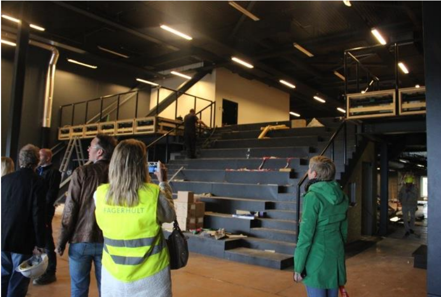
Eventrummet hvor der vil blive afholdt forskellige events.