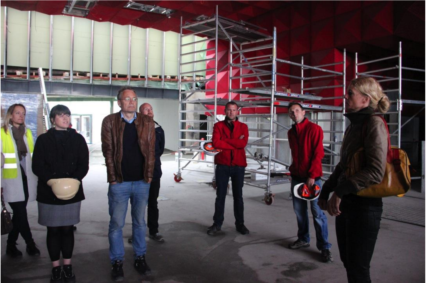
Danmarks Rockmuseum åbner omkring årsskiftet 2015/2016.