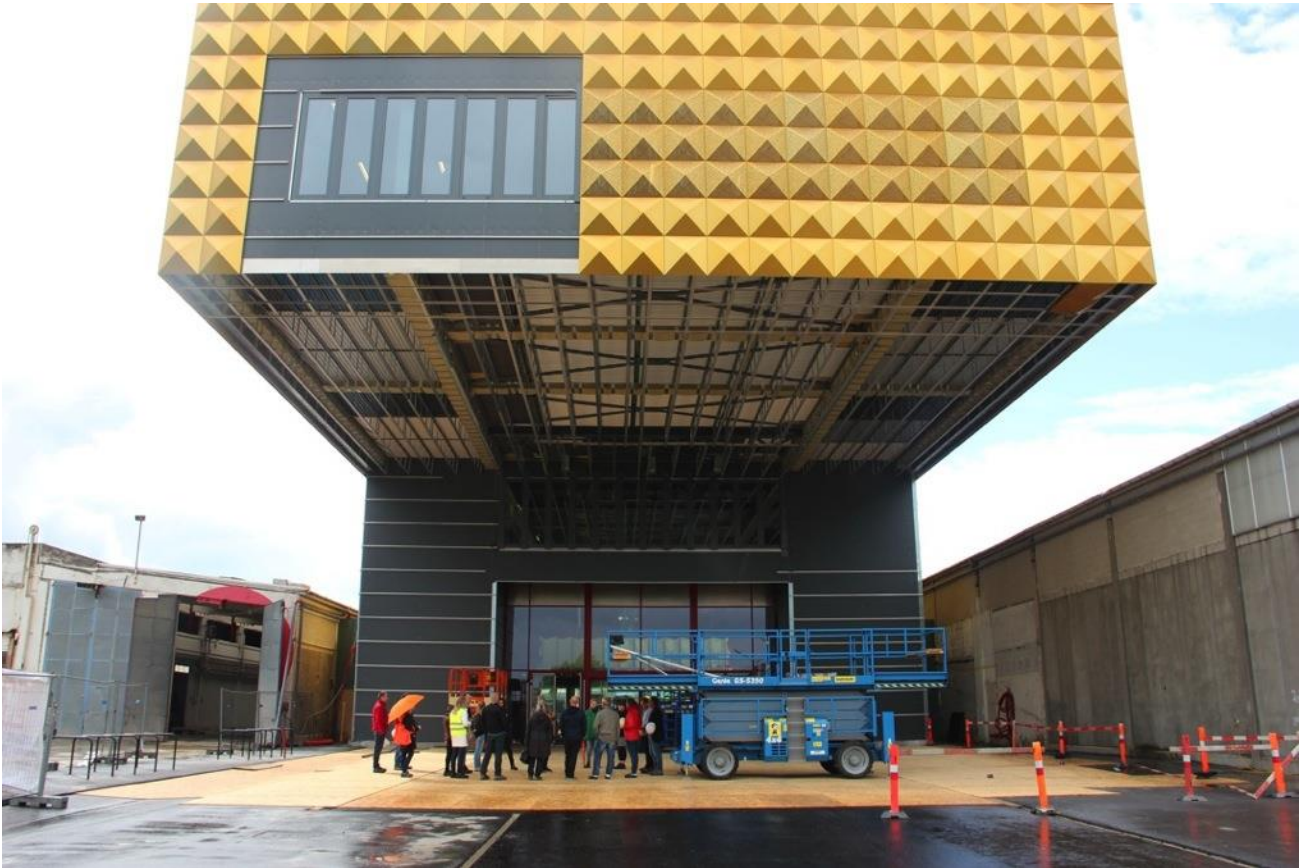
Danmarks Rockmuseum er tegnet af det hollandske arkitektfirma MVRDV i samarbejde med det danske arkitektfirma COBE Arkitekter.