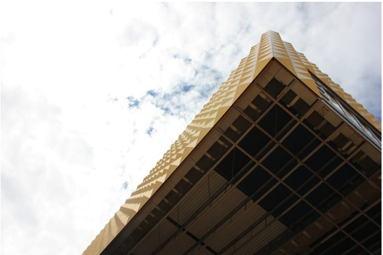
Facaden på Danmarks Rockmuseum er beklædt med gyldne pyramider/nitter, som gør bygningen meget bemærkelsesværdig. Udhængen på bygningen er 20 meter langt og selvbærende.